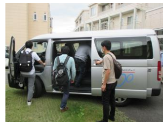
送迎を使用する場面